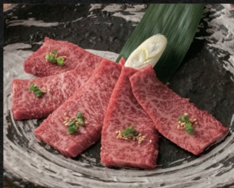
和牛ササミカルビ