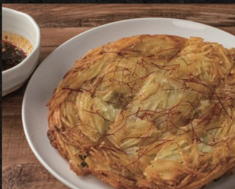
じゃがいものチヂミ