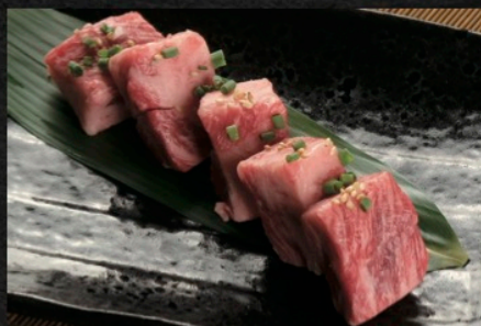
中落ち角切り和牛カルビ