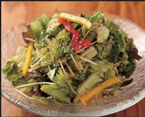
本格チョレギサラダ