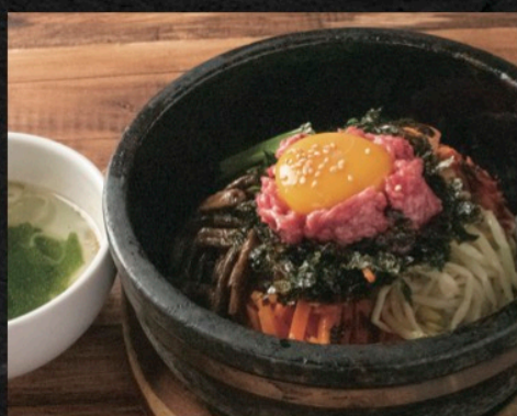
石焼ユッケビビンバ