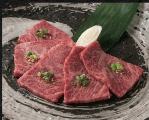
和牛カイノミカルビ